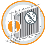
ESTHÉTIQUE ET SILENCIEUX