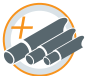
LARGE GAMME JUSQU'AU Ø 75 MM