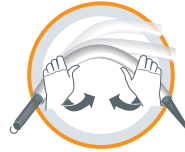
SE CINTRE À LA MAIN ET GARDE SA FORME*