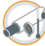
FAIBLE DILATATION À LA CHALEUR